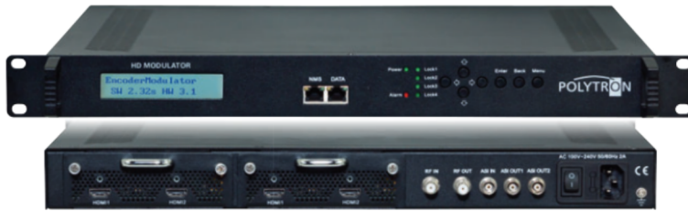
Vorderseite / Front